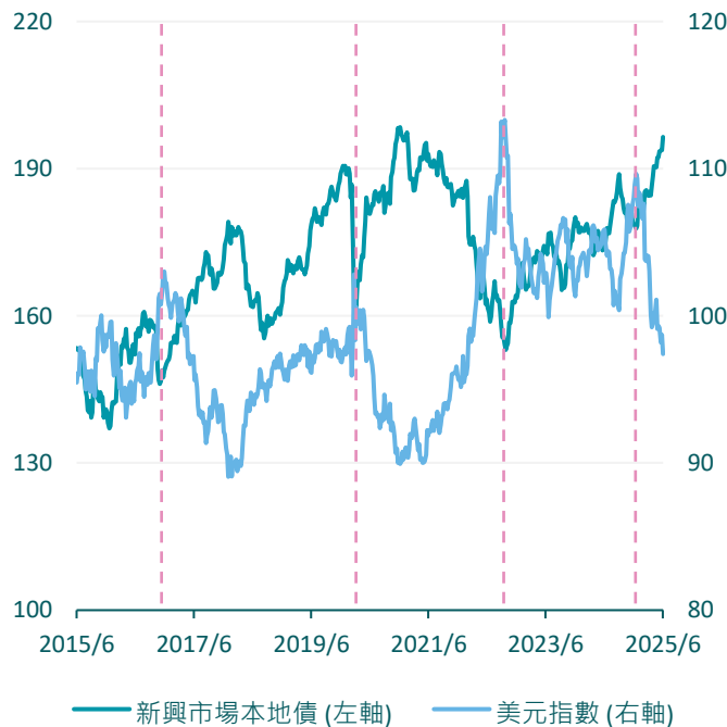
過去 10 年美元指數及新興本地債指數走勢